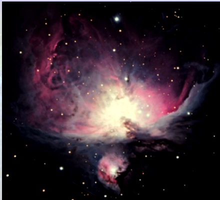
M42 Grande nebulosa di Orione