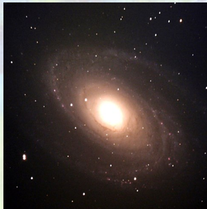
M81 Galassia a spirale